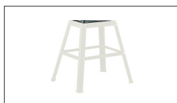
Réf : 10000391 Socle d'appareil JDR-34